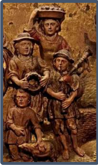
Gaiteyro e ferreñeira no s, XVII Colexiata de Sta. María de Vigo. Museo Diocesano de Tui

Froito tamén dese afán por dotar de antigüidade á danza de espadas de Marín, consiste en datar rotundamente a súa orixe en 1639 (se non antes), baseándose na entrada do libro de Contas da Confraría na que se apunta que se lle gasta unha cantidade para salario “do gaiteyro Tom...do ferreñeiro e convinte de danzantes no día do Corpus”. Nin nesa entrada nin na outra entrada onde se fala de danzantes en 1641, nin en ningún dos dous libros de Contas que se conservan no Arquivo Histórico Diocesano de Santiago se fala especificamente dunha “danza de espadas”. O máis probable, coñecendo a realidade das confrarías gremiais da nosa ría no século XVII, é que tanto esta danza como a que executa a confraría de San Telmo dos mariñeiros do Cantodarea fose unha danza de espadas, pero sendo honestos entramos dentro do ámbito da suposición.