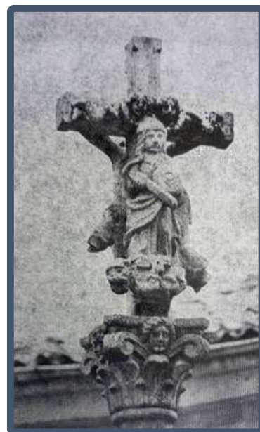
San Miguel no cruceiro de Estribela, hoxe en Pontevedra