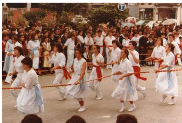
1982. Mulleres na ringleira dos homes, vestidas de "homes"