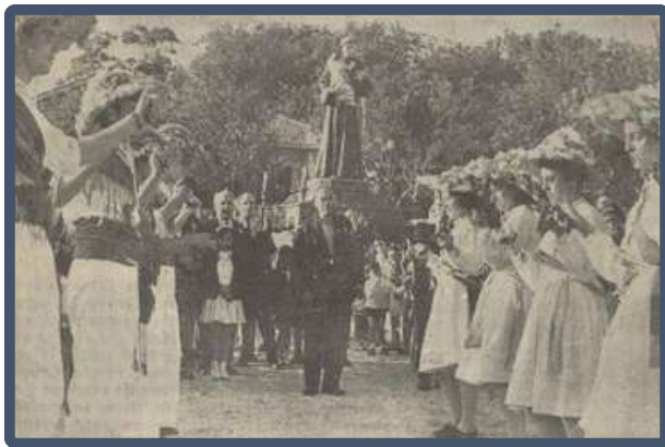
1964. Coros e Danzas de Marín na Florida (Vigo)

Autenticidade, fidelidade e uniformidade son valores que os Coros e Danzas da Sección Feminina perseguen na execución das danzas, e que as súas participantes traen á nosa danza. A uniformidade como valor na execución da nosa danza verase moi lastrada pola moral puritana do réxime que impide que as mulleres poidan gastar pantalóns, polo que para poder bailar