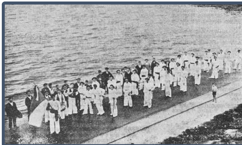
1934. Danza de Espadas do Cantodarea diante do Concello